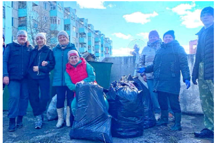
Администрация города Кедрового

Выражаем благодарность всем тем, кто принял активное участие в санитарной уборке!