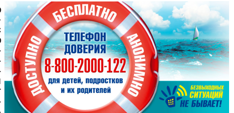
График работы детского телефона доверия в Томской области (по состоянию на 01.05.2014) ежедневно с 08.00 до 22.00.

Цель такой помощи - способствовать профилактике семейного неблагополучия, стрессовых и суицидальных настроений детей и подростков, защите прав детей и укреплению семьи.