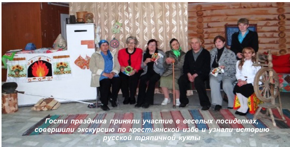
Гости праздника приняли участие в веселых посиделках, совершили экскурсию по крестьянской избе и узнали историю русской тряпичной куклы

Областным департаментом социальной защиты населения ежегодно совместно с департаментом по молодежной политике, физической культуре и спорту и департаментом культуры организуется областной этап Фестиваля "Преодолей себя".