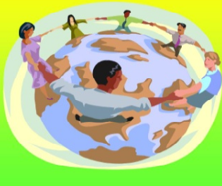
Конвенция о правах ребенка.

Благополучие детей, защита их прав являются настоящей заботой ООН. Чтобы сконцентрировать внимание на решении проблем, касающихся детей, одним из первых актов Генеральной Ассамблеи ООН было образование в 1946 году Детского фонда ООН (ЮНИСЕФ), который и сегодня остается главным органом, осуществляющим международную помощь детям.