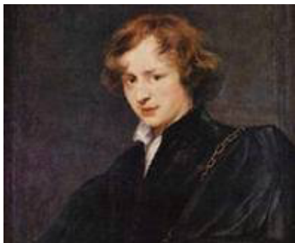
Ван Дейк (фрагмент автопортрета)

22 марта 1599 - 9 декабря 1641 417 лет назад 375 лет назад