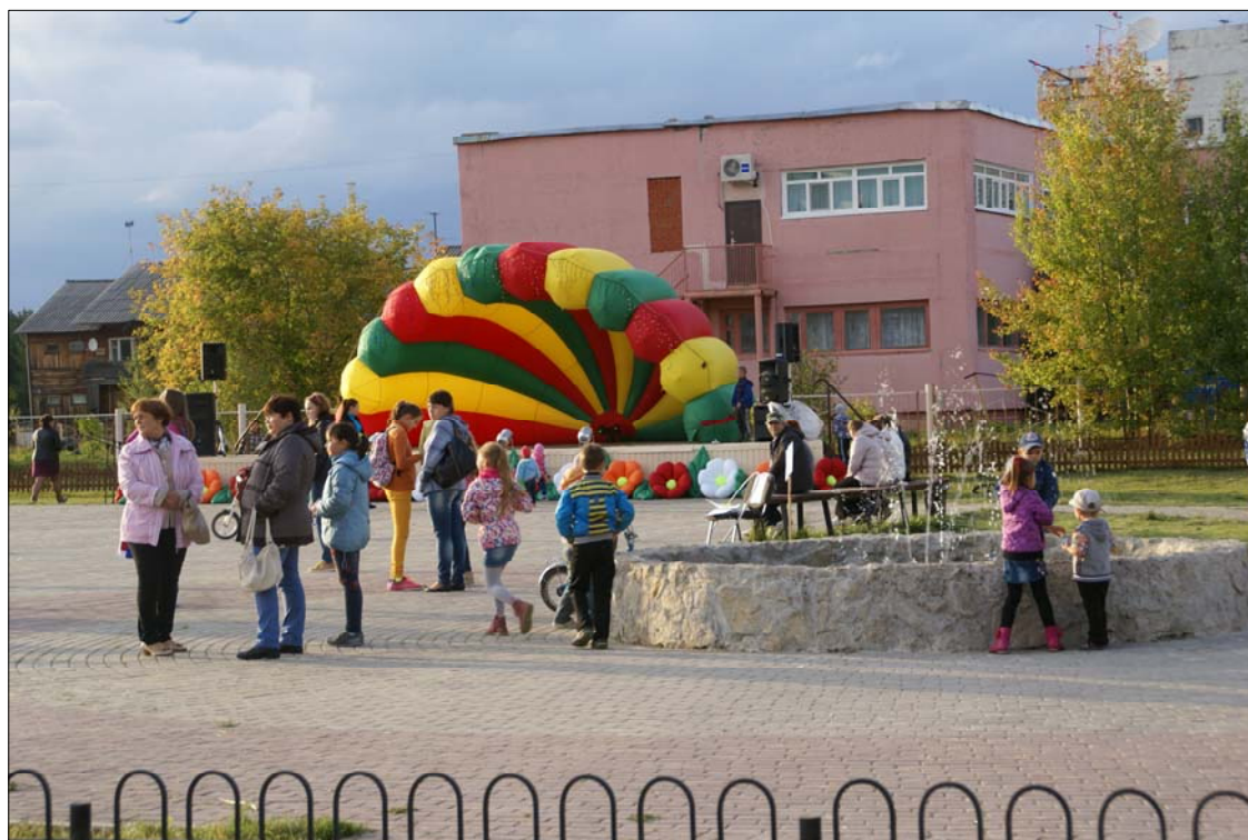
Фрагмент проведения массовых мероприятий