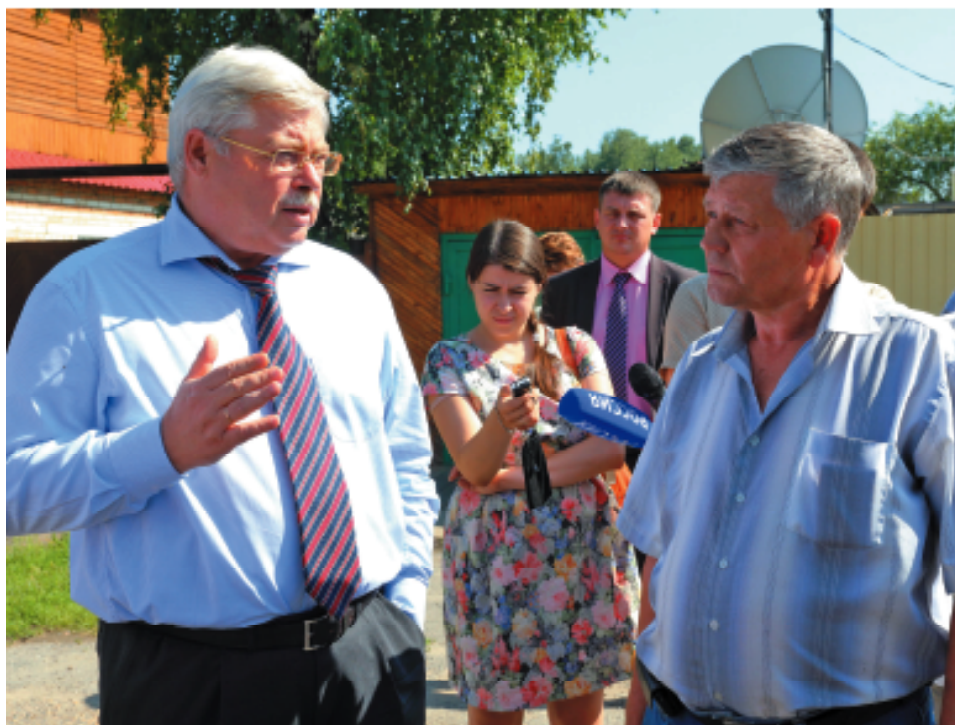
■ Программу ремонта дорог губернатор разработал вместе с людьми