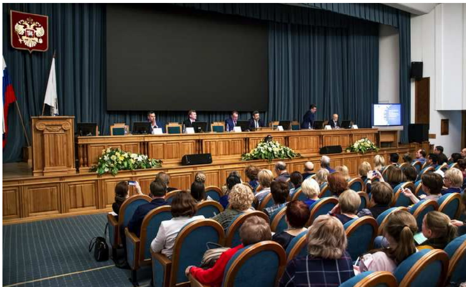
На форуме собрались участники из Республик Алтай, Бурятия, Татарстан, Тыва, Удмуртия, Кемеровской, Новосибирской, Омской, Оренбургской, Астраханской, Свердловской, Тюменской областей, Красноярского, Алтайского и Забайкальского краев.