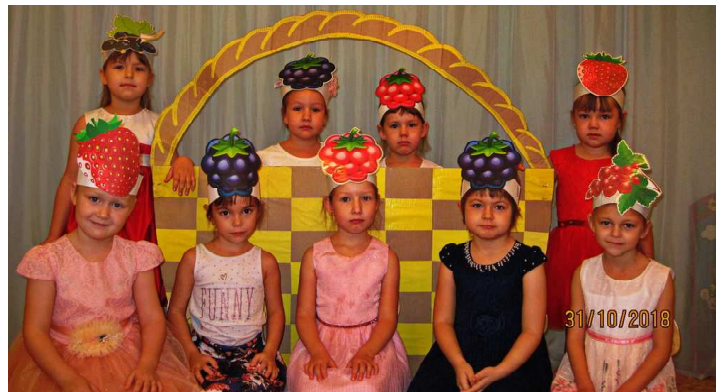
Девочки старшей группы. Танец "Ягодки-кокетки"

Успех утренников и концертов - это всегда итог коллективной работы: детей, сотрудников детского сада, родителей. Вот так: кто-то помог выучить стихотворение, кто-то вырезал листочки для