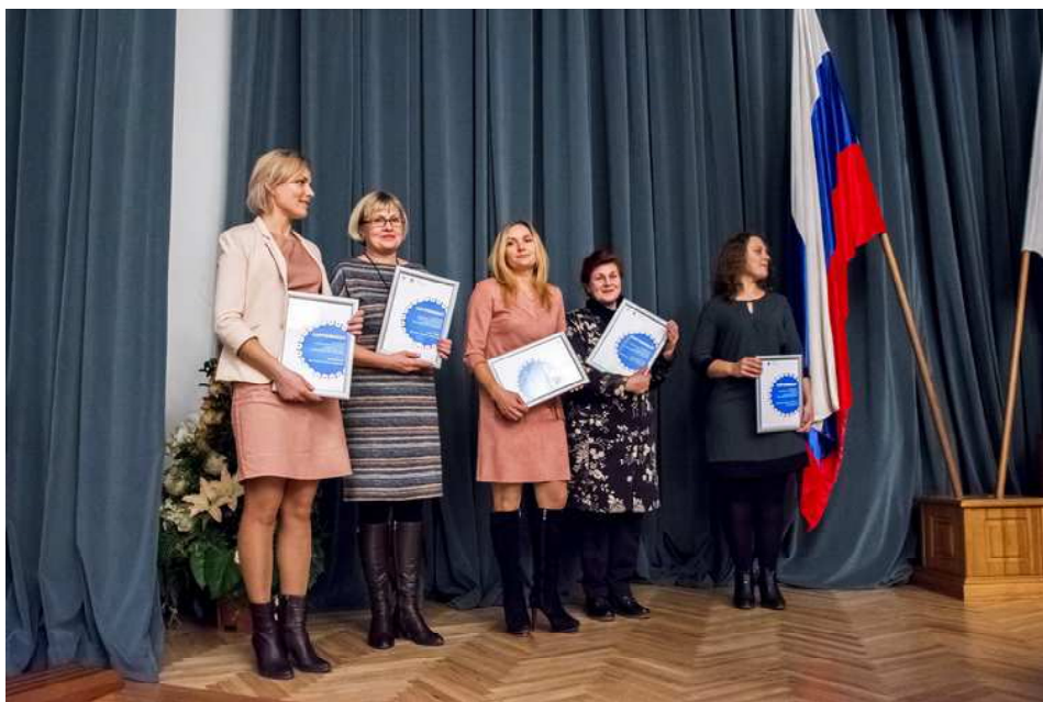
Проект "Детские школы искусств - достояние России" стартовал по поручению Президента РФ, данного по итогам совещания по вопросам поддержки талантливой молодежи в сфере культуры и искусства в ноябре 2017 года в Санкт-Петербурге.

Лучшие работы учеников этих лицеев расположились в фойе Томской филармонии на выставке "Отечественное художественное образование". Открытие этой выставки состоялось перед концертом,