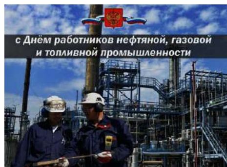
с Днём работников нефтяной, газовой и топливной промышленности