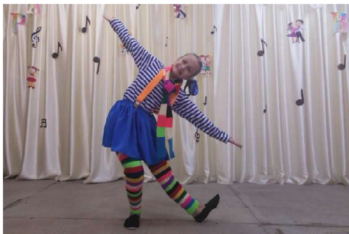
Распределение призовых мест ИЗО