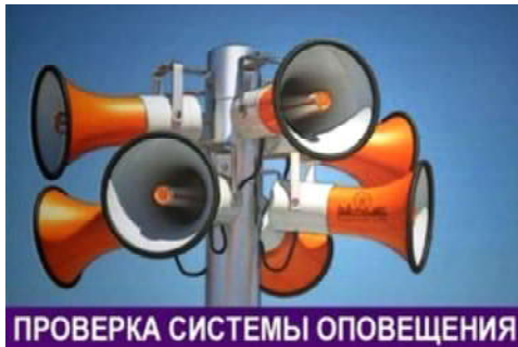
ПРОВЕРКА СИСТЕМЫ ОПОВЕЩЕНИЯ

Региональная автоматизированная система централизованного оповещения предназначена для обеспечения