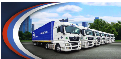
С ДНЕМ РАБОТНИКА АВТОМОБИЛЬНОГО ТРАНСПОРТА!

Мы в Томской области не только системно ремонтируем дороги в городах и районах, но и обновляем пассажирский транспорт,