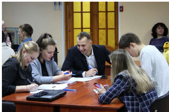
Молодежный парламент МО "Город Кедровый"