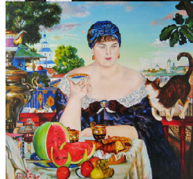
Б.М. Кустодиев Купчиха за чаем 1918

Кустодиев Борис Михайлович (1878- 1927), художник. Родился 7 марта 1878 г. в Астрахани в семье преподавателя семинарии. Отец рано умер, и мальчик обучался в этом заведении на казённый счет.