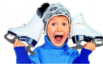
ГРАФИК РАБОТЫ ПУНКТОВ ПРОКАТА ЛЫЖ И КОНЬКОВ В МО "ГОРОД КЕДРОВЫЙ"

Пункт проката г. Кедрового по адресу: г. Кедровый, 1 мкр., д. 61 (здание МКОУ СОШ № 1 г. Кедрового, вход с крыльца первого микрорайона).