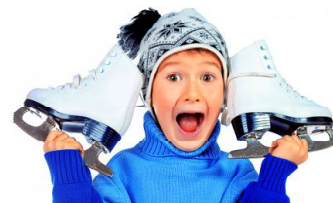
ГРАФИК РАБОТЫ ПУНКТОВ ПРОКАТА ЛЫЖ И КОНЬКОВ В МО "ГОРОД КЕДРОВЫЙ"

Пункт проката г. Кедрового по адресу: г. Кедровый, 1 мкр. д. 61 (здание МКОУ СОШ № 1 г. Кедрового, вход с крыльца первого микрорайона).