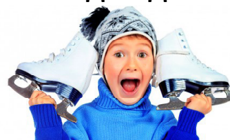
ГРАФИК РАБОТЫ ПУНКТОВ ПРОКАТА ЛЫЖ И КОНЬКОВ В МО "ГОРОД КЕДРОВЫЙ"

Пункт проката г. Кедрового по адресу: г. Кедровый, 1 мкр., д. 61 (здание МКОУ СОШ № 1 г. Кедрового, вход с крыльца первого микрорайона).