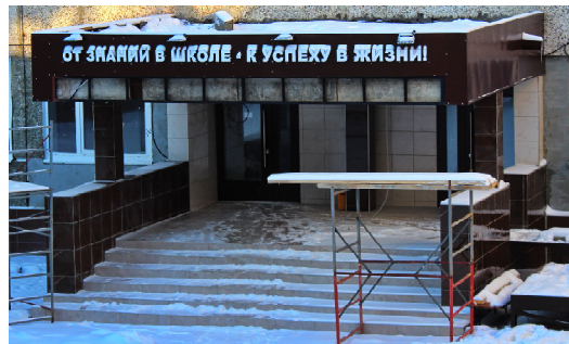
Отдел образования администрации г. Кедрового

И дети, и педагоги, и родители с нетерпением ждут окончания ремонтных работ и возвращения в родные школьные стены.