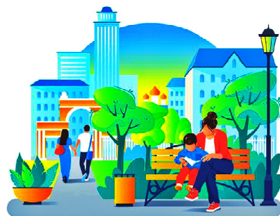
Администрация города Кедрового