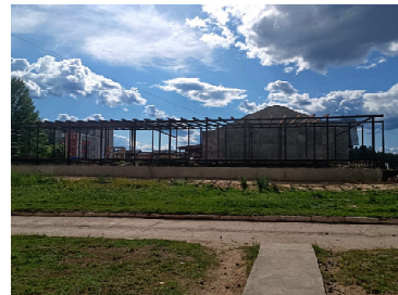
Администрация города Кедрового

На объекте ведутся монтажные работы и для соблюдения правил техники безопасности, Администрация города Кедрового призывает жителей, детей и подростков не заходить на территорию данного общественного пространства.