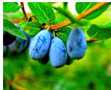
Подслушала и пересказала вам сказ дедушки Кедра бабушка Нюра

Вот такой сказ-легенду подслушала я, отдыхая под старым кедром. Прав дедушка Кедр - велика целительская сила жимолости. Изучили учёные жимолость и признали её чудодейственной. Чего только не лечит удивительная жимолость - всего и не перечислить. Одним словом - здоровье сберегает. А здоровый человек всегда выглядит молодо. А молодость и красота вместе об руку идут.