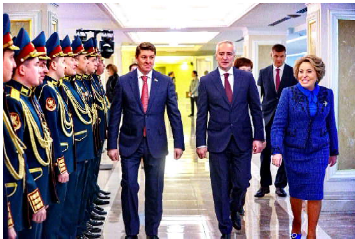
Департамент информационной политики Администрации Томской области

По итогам проведения Дней региона администрация Томской области разработает план мероприятий по взаимодействию с федеральными органами исполнительной власти для реализации всех рекомендаций, содержащихся в Постановлении Совета Федерации.