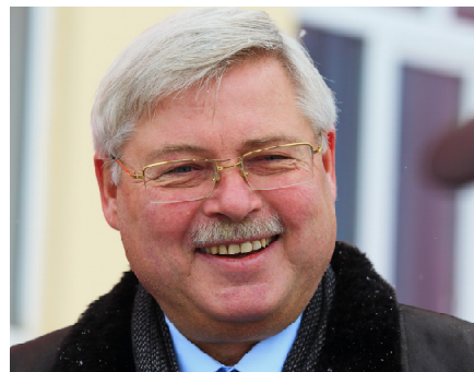
Губернатор Сергей ЖВАЧКИН